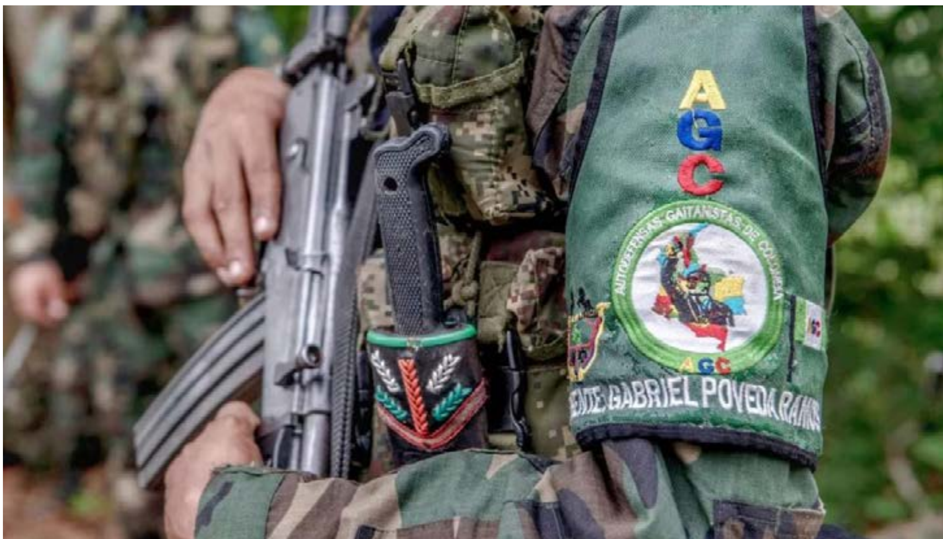
Clan del Golfo o Ejército Gaitanista de Colombia (EGC)