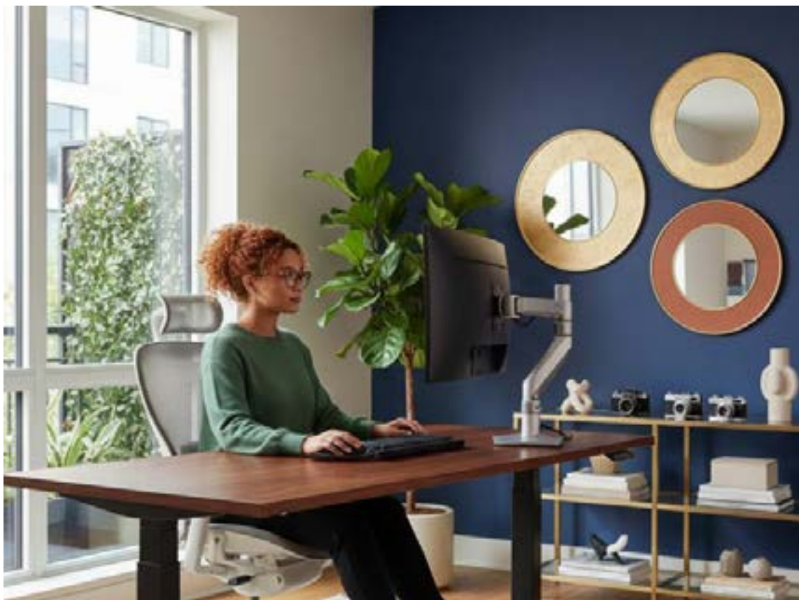
Las ocupaciones de apoyo administrativo y los profesionales científicos son las que más se benefician de esta modalidad.

El teletrabajo no solo ha diversificado la oferta laboral, sino que también ha demostrado ser un motor