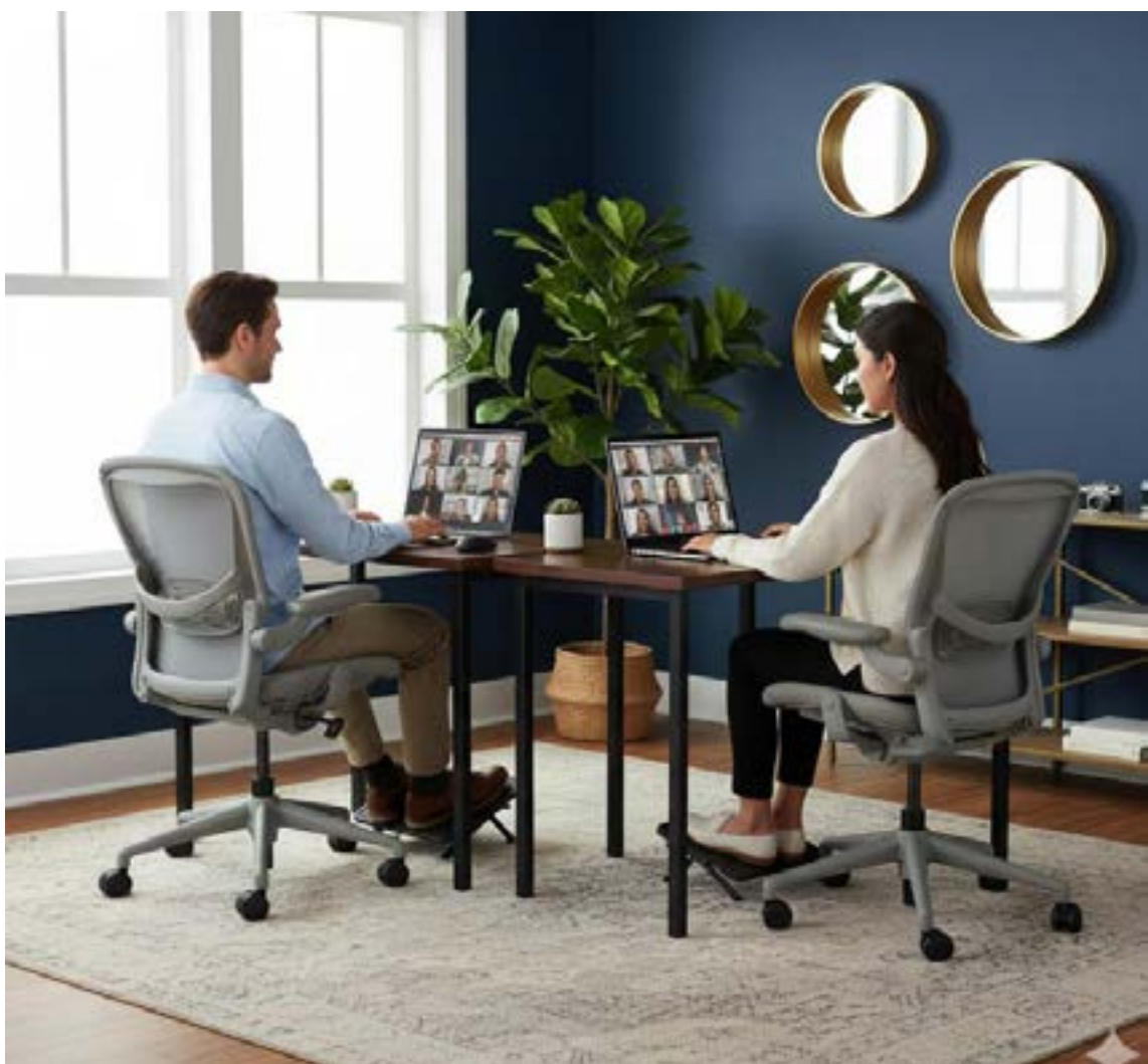
La evidencia del Servicio Público de Empleo respalda esta consolidación, mostrando que entre 2019 y 2024, el 7 % de las vacantes registradas eran compatibles con el teletrabajo.

de eficiencia. Los datos indican que los sectores con potencial de trabajo remoto experimentaron un crecimiento del 4.4 % en sus vacantes en comparación con aquellos sin esta opción. Además, se ha comprobado que esta modalidad facilita el emparejamiento entre la oferta y la demanda, reduciendo las tasas de desempleo en ocupaciones compatibles. Aunque las vacantes a distancia ofrecen salarios más altos —entre un 10 % y un 23 % superior—, esta diferencia se debe a que las posiciones más calificadas son las que más se teletrabajan, y no a que la modalidad pague mejor en sí misma.