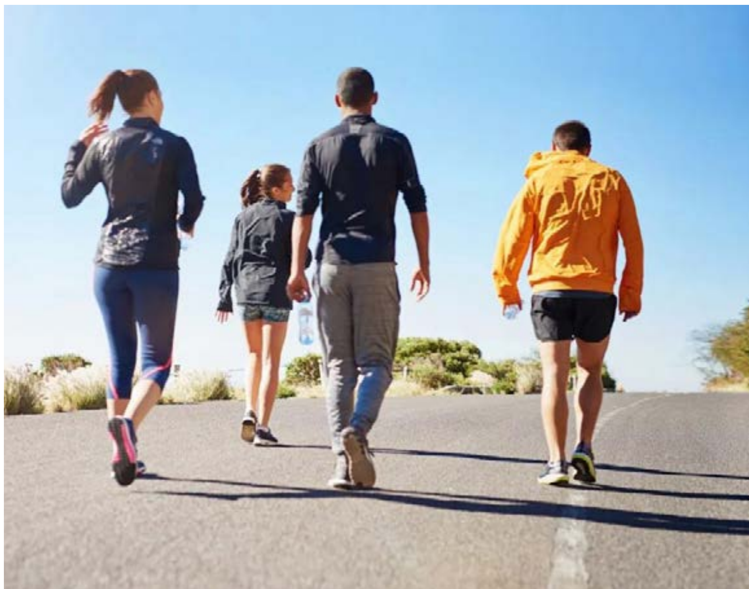
Caminar 30 minutos al día mejora la calidad de vida

Los beneficios de caminar se extienden a todo el cuerpo, impactando de manera positiva en nuestra salud integral: