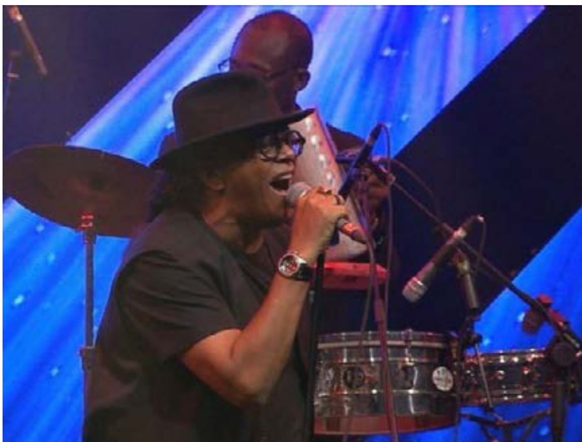
Sergio Vargas, nacido en 1960 en la República Dominicana, es una figura clave en la historia del merengue.