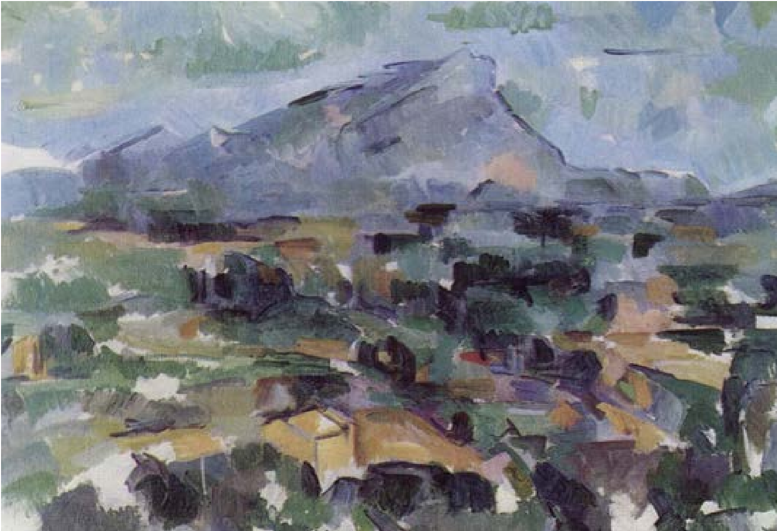
La montaña Sainete-Victoire 1905

Con el tiempo, Louis Auguste decidió comprar el único banco que existía en Aix-des-Provence. Lo dirigió con disciplina. Los Cézanne se hicieron ricos como banqueros y las ganancias llegaron a borbotones. La plata que Paul recibía de su padre, ascendió a 125 francos mensuales. Ya no tenía que preocuparse por los gastos, los costos y las deudas futuras. Era una fortuna que bajaba del cielo.