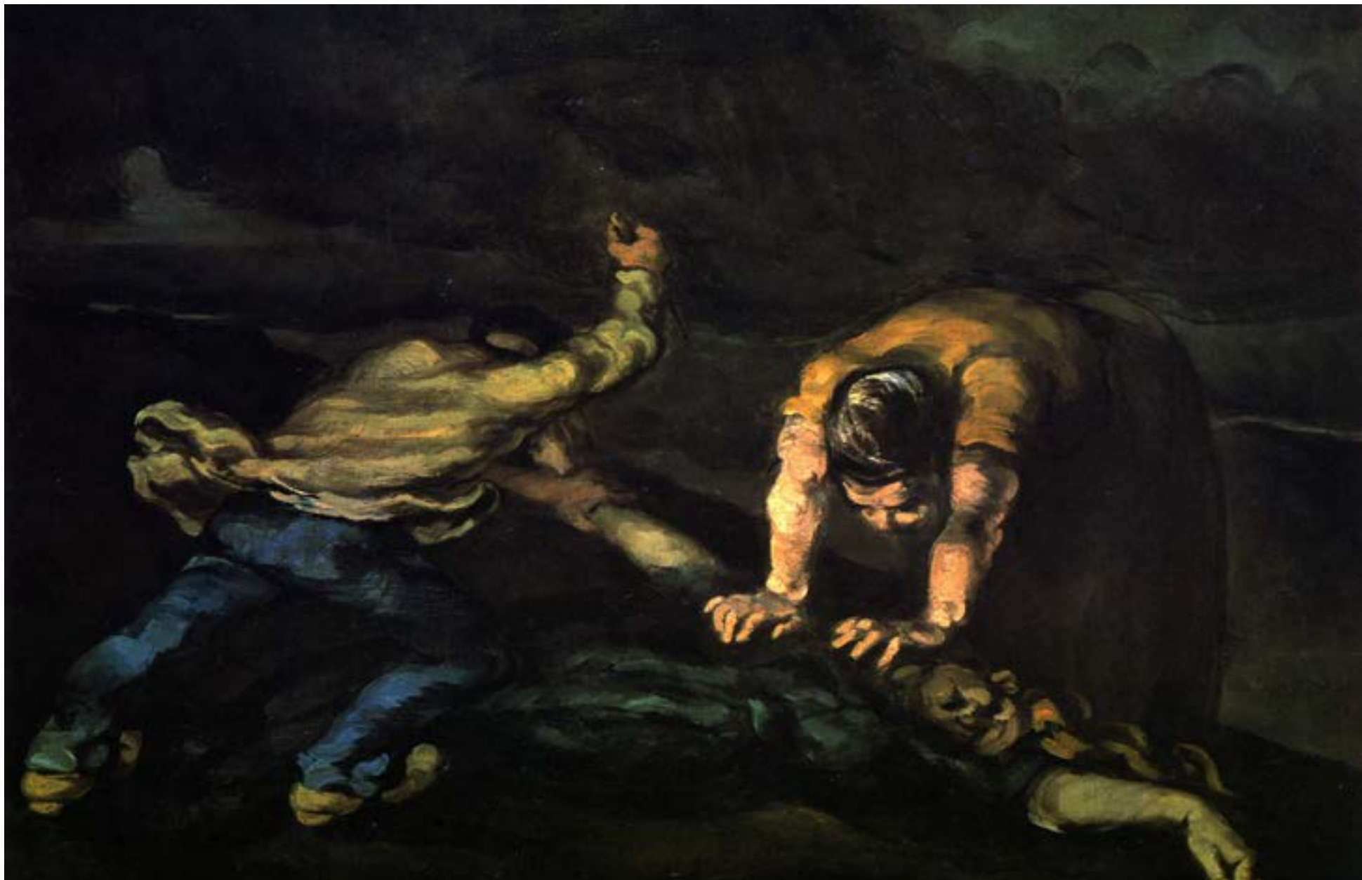
El asesinato, h. 1870