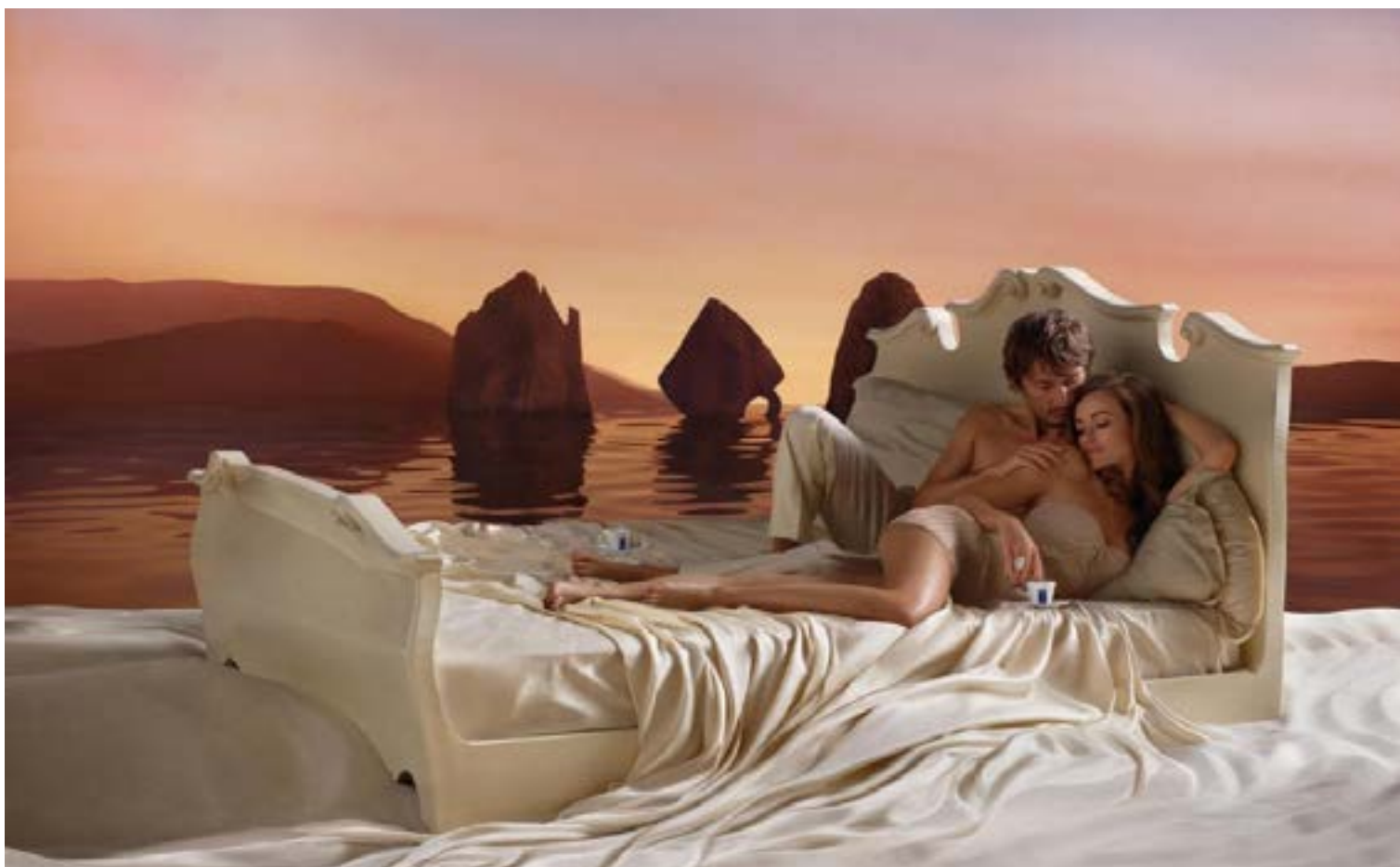
La hora más oportuna para el sexo, según la publicación, es a las 5:48 de la mañana.

Según la investigación, a esa hora, en el caso de los hombres el nivel de testosterona puede aumentar hasta un 50% más que durante el resto del día, esto porque la glándula que regula su producción está más activa durante el sueño.