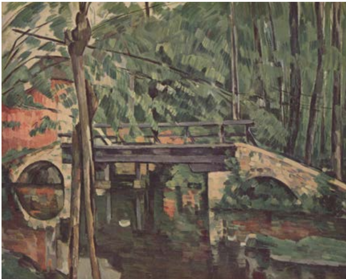
El puente de Maincy, 1879-1880